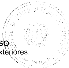
CARLOS MORALES TRONCOSO Secretario de Estado de Relaciones Exteriores.