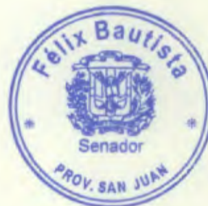
Félix Bautista Senador Provincia San Juan

Agradeciendo su especial colaboración, les saludo con sentimientos de la más alta consideración.