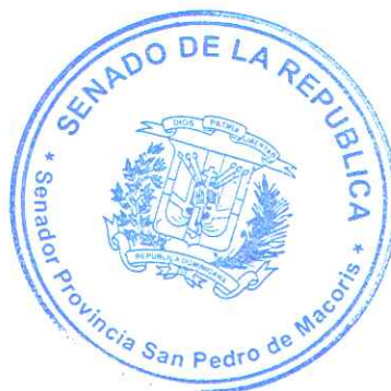
Dr. Franklin Peña V. Senador por la Provincia San Pedro de Macorís.