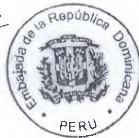
RAFAEL JULIÁN Embajador

Hago propicia la ocasión para reiterarle las seguridades de mi más alta consideración y estima personal.