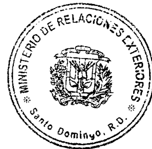
Miguel Vargas Ministro de Relaciones Exteriores