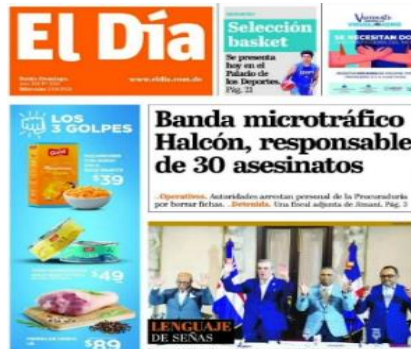
Publicación del periódico El Día

llegó; o sea, el desbordamiento de la delincuencia aquí en el Gran Santo Domingo, sobre todo en el Distrito Nacional, que es el que yo voy a representar a partir de agosto, llega a Santiago, presidente.