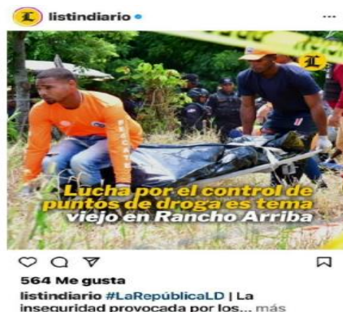
Publicación en la cuenta de Instagram del periódico Listín Diario