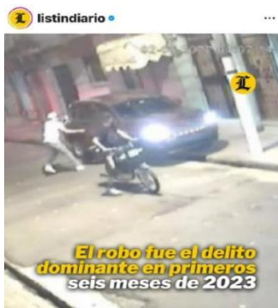
Publicación en la cuenta de Instagram del periódico Listín Diario

“Banda microtráfico Halcón, responsable de treinta asesinatos”. Óigase bien, honorables senadores, esa banda es responsable de treinta asesinatos. Estamos viviendo el tiempo de Luis Abinader en la Policía Nacional, director en funciones, el presidente de la República en la Policía Nacional.