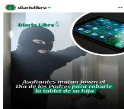
Publicación en la cuenta de Instagram del periódico Diario Libre