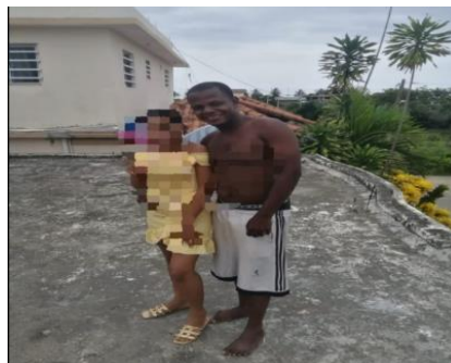
Niña desaparecida en Villa Altagracia

Miren, esa es una niña que está desaparecida, de 11 años, desde hace casi un mes, en la provincia San Cristóbal.