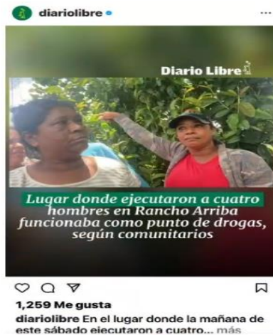
Publicación en la cuenta de Instagram del periódico Diario Libre

presidente, Luis Abinader eliminó el DICAN; no tiene interés en que se combata el microtráfico, consecuencia de todos estos hechos violentos y sangrientos: los puntos de drogas que se han proliferado en el Gobierno del PRM y de Luis Abinader.