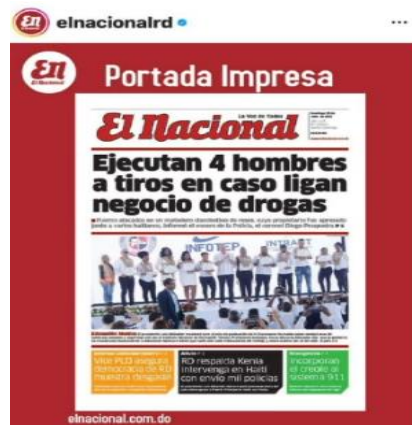
Publicación en la cuenta de Instagram del periódico El Nacional

Acta núm. 0180, del miércoles 02 de agosto de 2023, pág. núm. 24 de 85