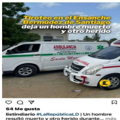
Publicación en la cuenta de Instagram del periódico Listín Diario

“Lugar donde ejecutaron a cuatro hombres en Rancho Arriba funcionaba como punto de drogas, según comunitarios”. ¡Qué pena! Estamos cambiando, presidente, estamos cambiando. Ese es el cambio que nos ha traído Luis Abinader y el PRM. Veinticinco mil millones de dólares (USD$25,000,000,000.00) prestados sin saber adónde se han invertido; hoy, trescientos noventa millones más, en la próxima semana, trescientos millones de dólares (USD$300,000,000.00) más. Estamos cambiando, este es el cambio que nos merecemos, según Luis Rodolfo Abinader, los dominicanos.