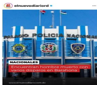
Publicación en la cuenta de Instagram del periódico El Nuevo Diario

“Asaltantes matan joven el Día de los Padres para robarle la tablet de su hija”. ¡Qué pena que en momentos que... por eso reitero: ha fracasado como mandatario y ha fracasado también como director de la Policía Nacional! no hay un día. Yo quiero decir, presidente, honorables senadores y senadoras, que lo que sale en los medios de comunicación es el 5%, porque lo que les llega, el parte de diario, al presidente y a la procuradora general de la República es 95 veces más de lo que nosotros vemos en los medios de comunicación. No hay quien salga a las calles en la administración del director de la Policía en funciones, Luis Rodolfo Abinader.