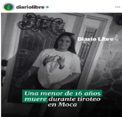
Publicación en la cuenta de Instagram del periódico Diario Libre