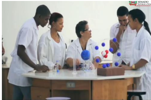
Estudiantes del Instituto Técnico Superior Comunitario (ITSC)

continuación, se coloca una imagen de mismo y se transcribe lo siguiente)