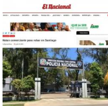
Publicación del periódico El Nacional