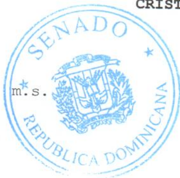
CRISTINA ALTAGRACIA LIZARDO MÉZQUITA, Presidenta del Senado.