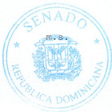
CRISTINA ALTAGRACIA LIZARDO MÉZQUITA, Presidenta del Senado.