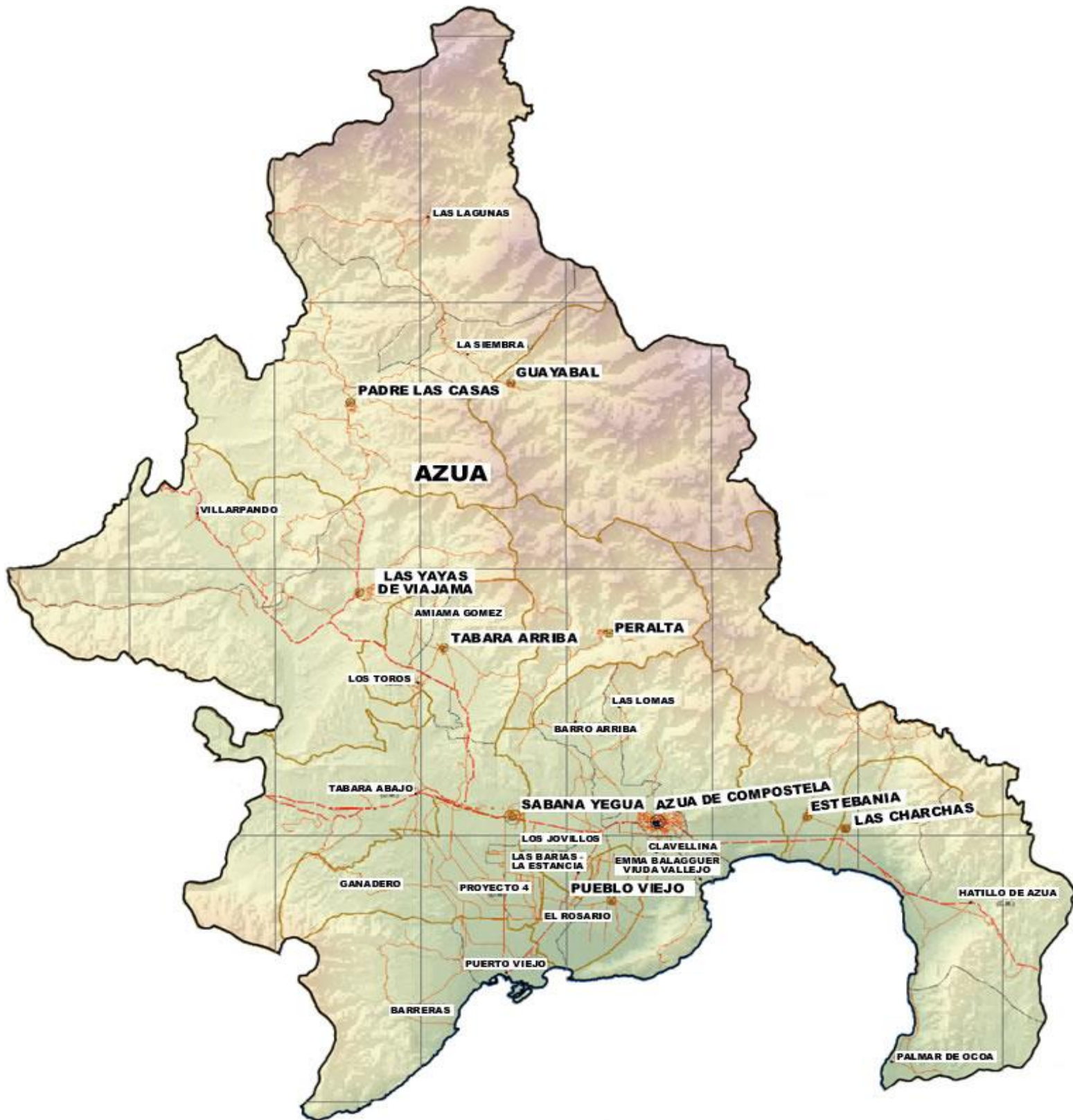
MAPA DE LA PROVINCIA DE AZUA