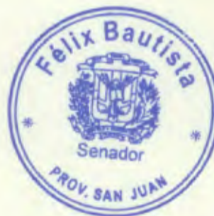
Félix Bautista Senador Provincia San Juan

Agradeciendo su especial colaboración, les saludo con sentimientos de la más alta consideración.