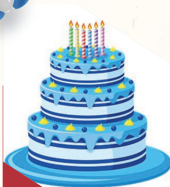
GRISSELLE VENTURA POLANCO