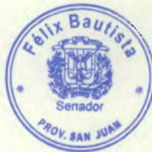
Félix Bautista Senador Provincia San Juan

Agradeciendo su especial colaboración, les saludo con sentimientos de la más alta consideración.