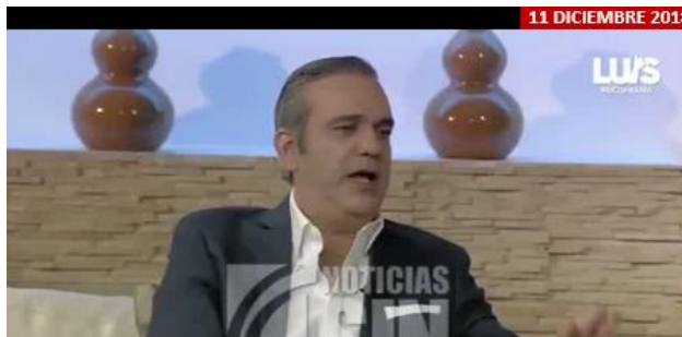
Luis Rodolfo Abinader Corona, Entonces candidato a la presidencia de la República Dominicana.