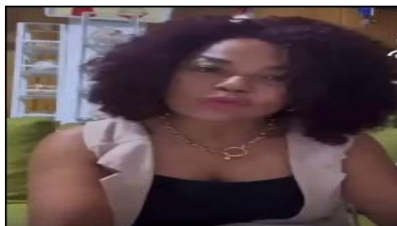
Mercedes José García (Cheddy García), actriz dominicana.

Presentadora: Mientras los tiroteos desde motores y vehículos en movimiento se han hecho frecuentes a lo largo de este año Ciudad Corazón, los atracos a mano armada ocurren a cualquier hora.