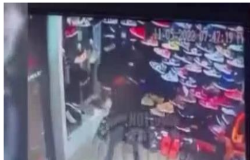
Vista de un robo registrado en video

No se oye. En vista de que no se están escuchando, presidente, se trata de imágenes de lo que está sucediendo en este país. En todo el país, no en el gran Santo Domingo, no en la provincia Santo Domingo, no en Santiago. Fíjense aquí cómo son, en plena luz del día, en la calle, un señor con su niño al hombro, y es despojado de sus bienes, así ha estado sucediendo.