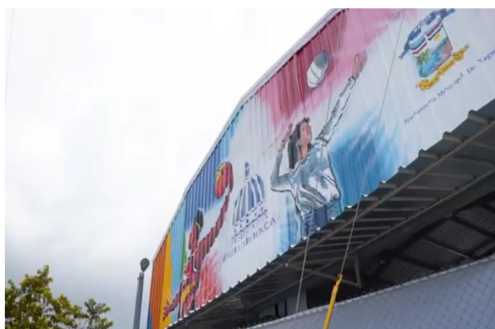
Fachada frontal de la cancha inaugurada por el presidente de la República Dominicana Luis R. Abinader Corona