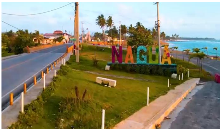
Entrada del municipio Nagua, provincia María Trinidad Sánchez