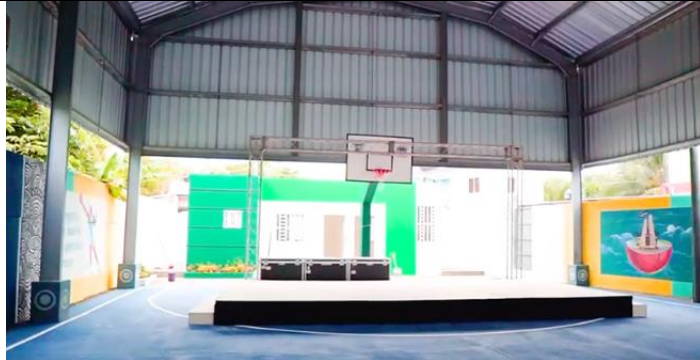
Cancha inaugurada en la provincia María Trinidad Sánchez

Acta núm. 0124, del lunes 25 de julio de 2022, pág. núm. 35 de 135