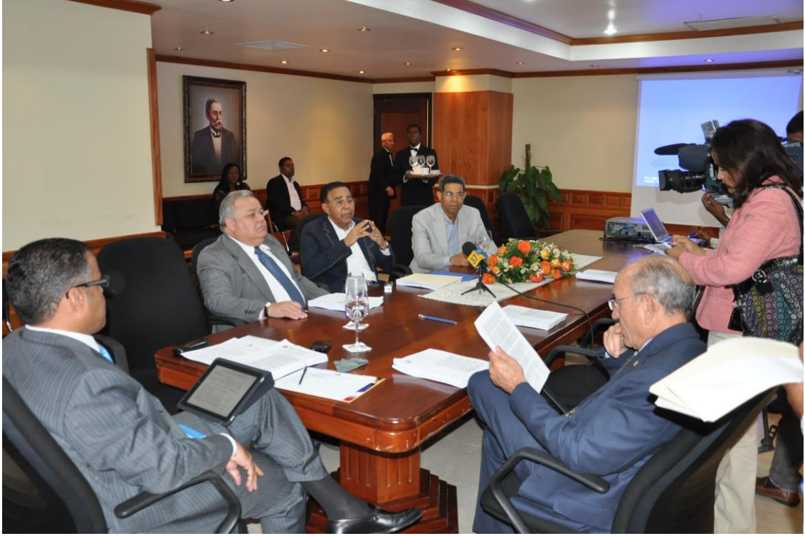
Reunión Comisión Permanente de Hacienda.