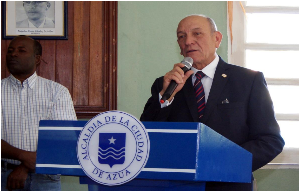
Rafael Calderón Martínez Senador Provincia de Azua. Acto Ayuntamiento Municipio Cabecera de Azua