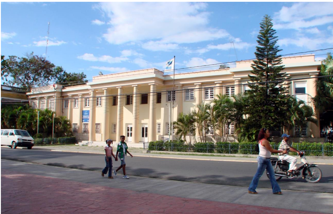
Palacio Municipal de Azua