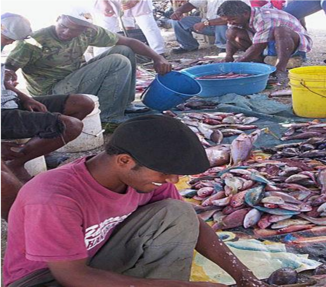
Pescadores en la costa de la provincia de Azua.