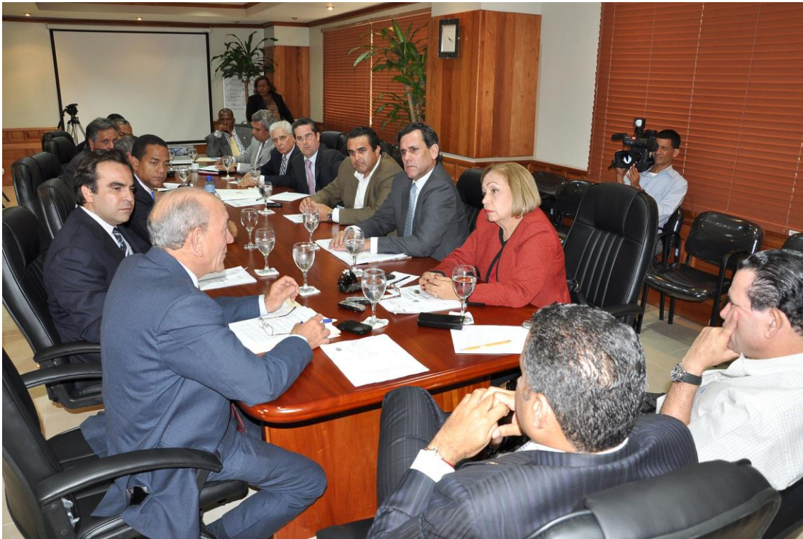
Reunión Comisión de Hacienda.