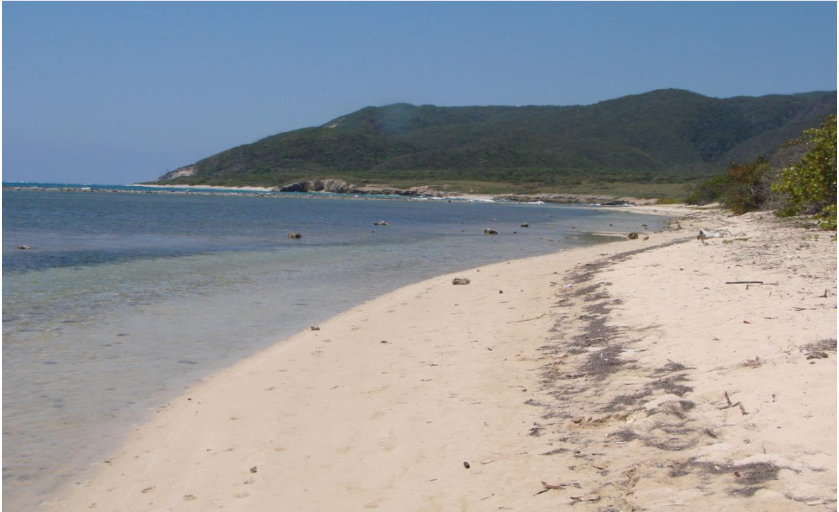
Playa Caobita y al fondo la punta de Martin Garcia embicada para saciar la sed que produce la tierra del sol.