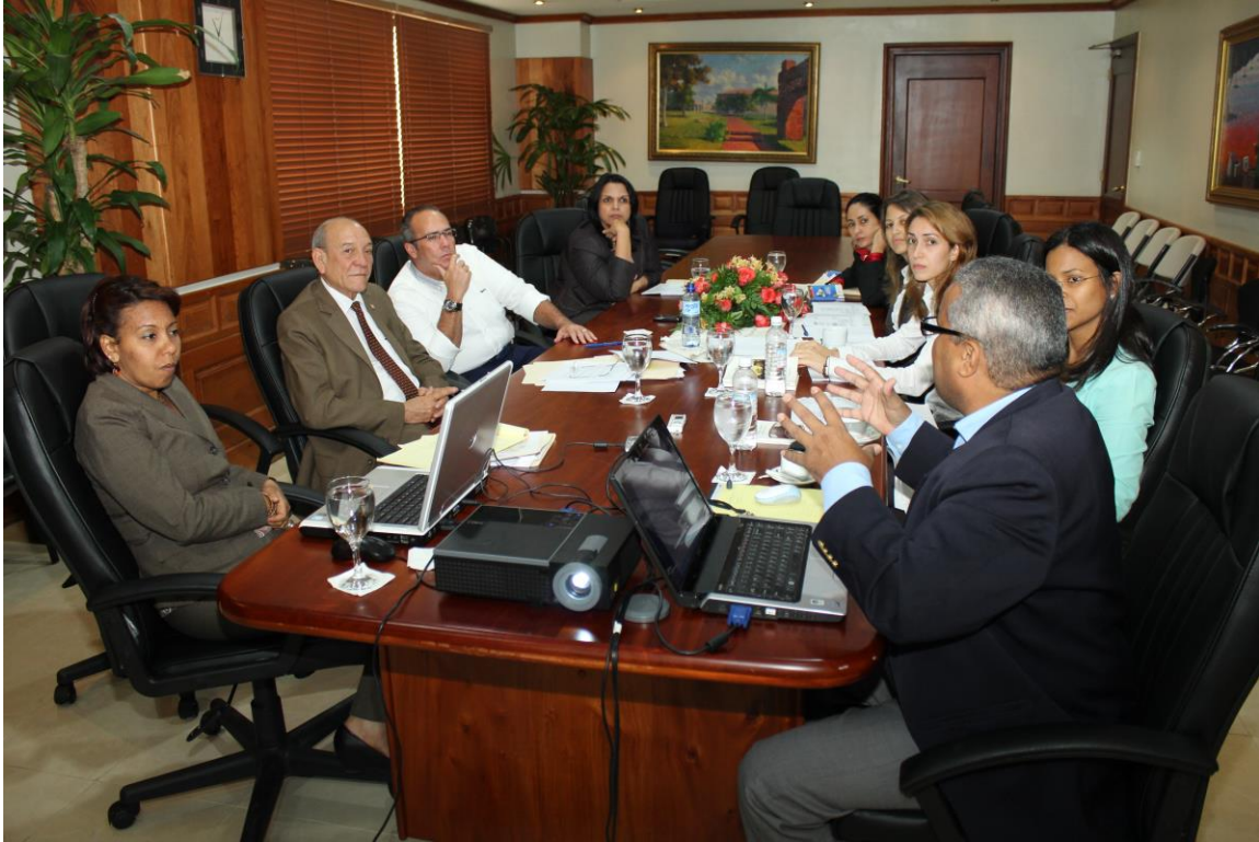
Comisión Especial Bicameral que estudia el Proyecto de Ley Fiscalización y Control.