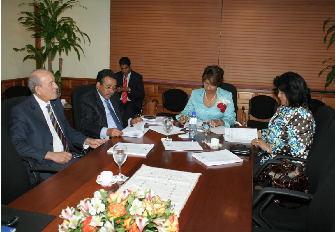
Reunión Comisión de Economía, Planificación y Desarrollo