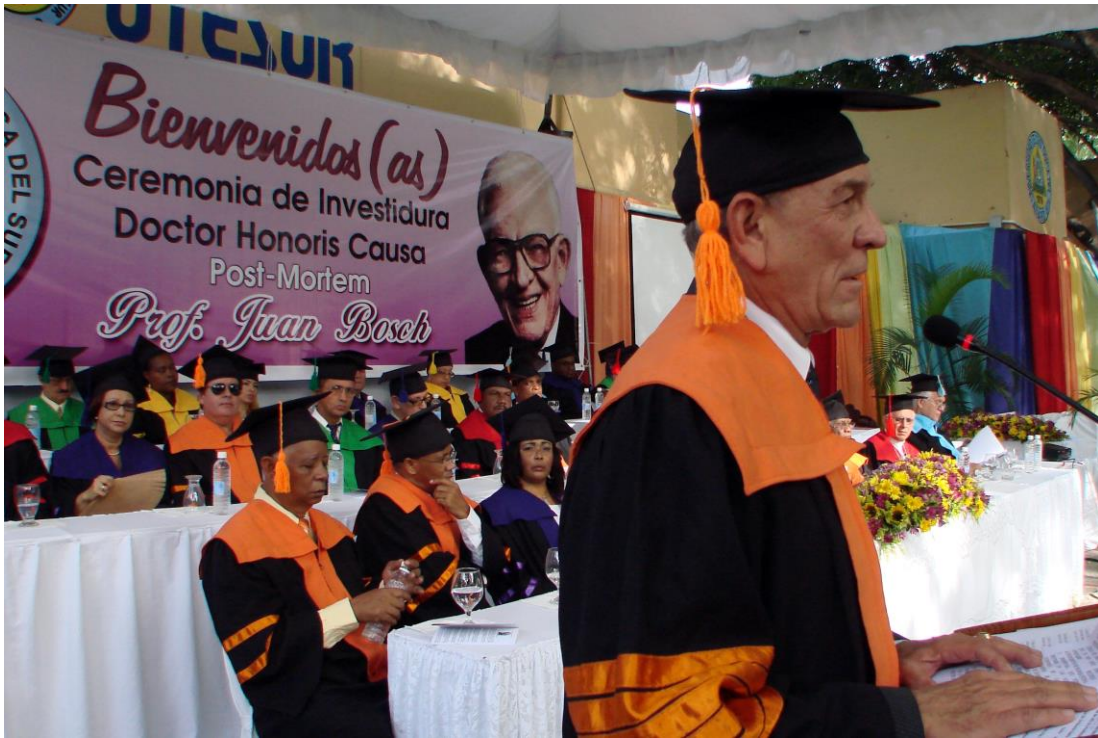
Ceremonia de investidura en la Universidad Tecnológica del Sur-UTESUR-, para otorgarle el título de Dr. Honoris Causa- Post-Mortem, al Profesor Juan Bosch.