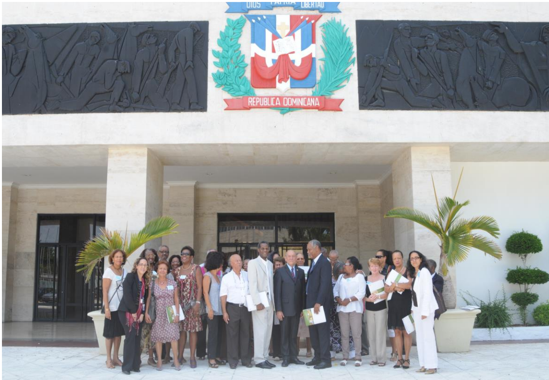
Compartiendo con profesores y alumnos de la Universidad de la Tercera Edad de Martinica en visita al Congreso Nacional.