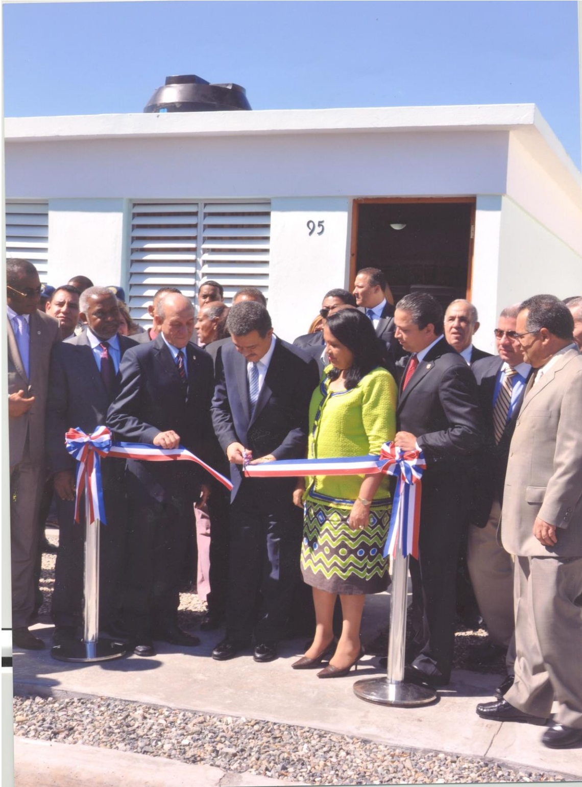
Inauguración de viviendas en Palmarejo, Azua