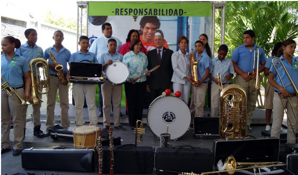
Acto de entrega de instrumentos musicales donados, a estudiantes de la escuela primaria de Azua, por el Despacho de la Primera Dama de la República, Doctora Margarita Cedeño de Fernández.