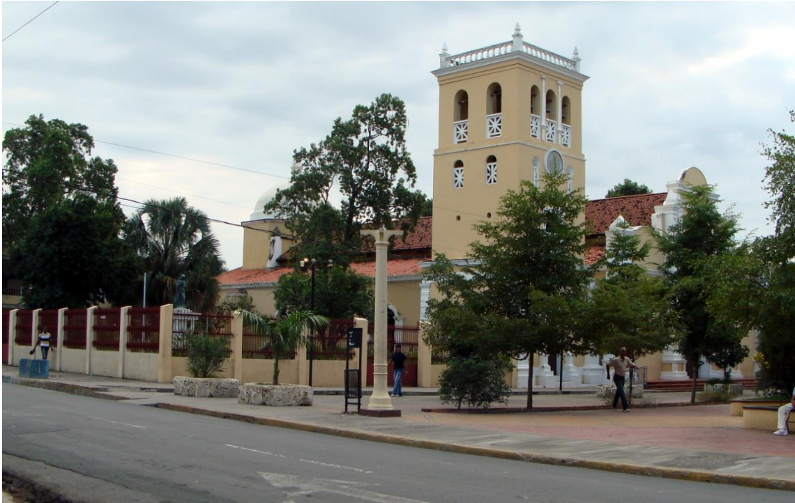
Iglesia Nuestra Señora de Los Remedios en Azua.