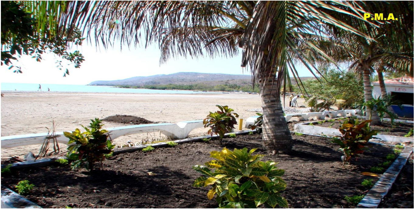
Playa histórica de Monte Rio-Azua.