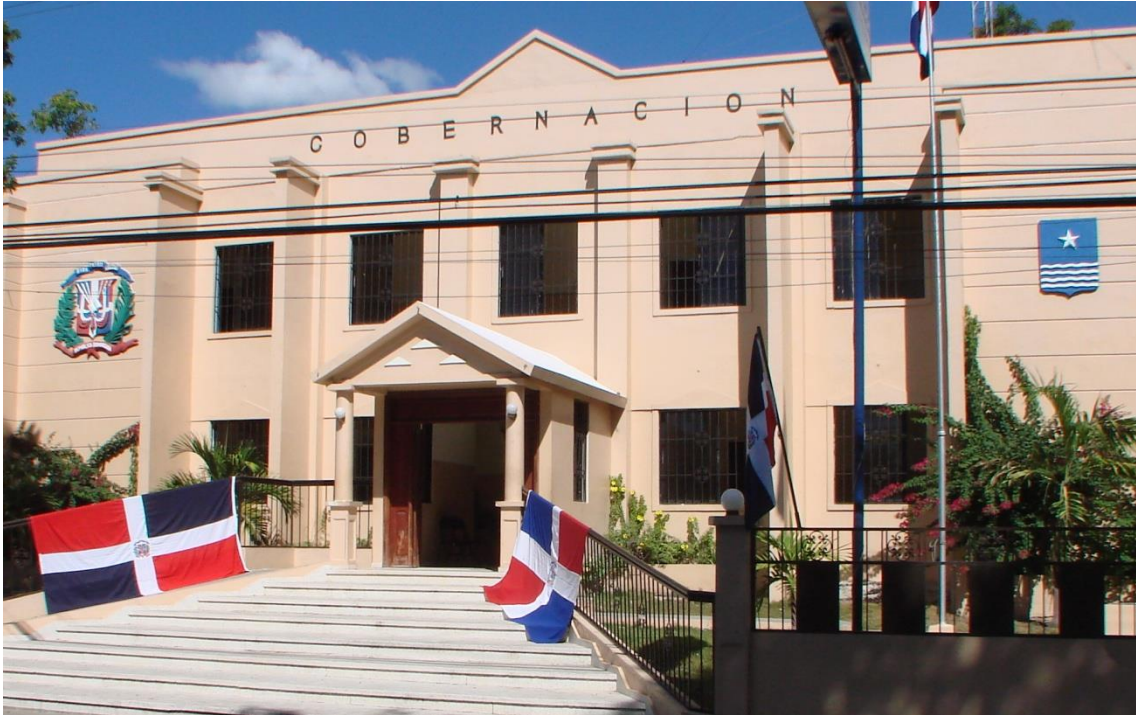
Palacio de Gobernación de la Provincia de Azua