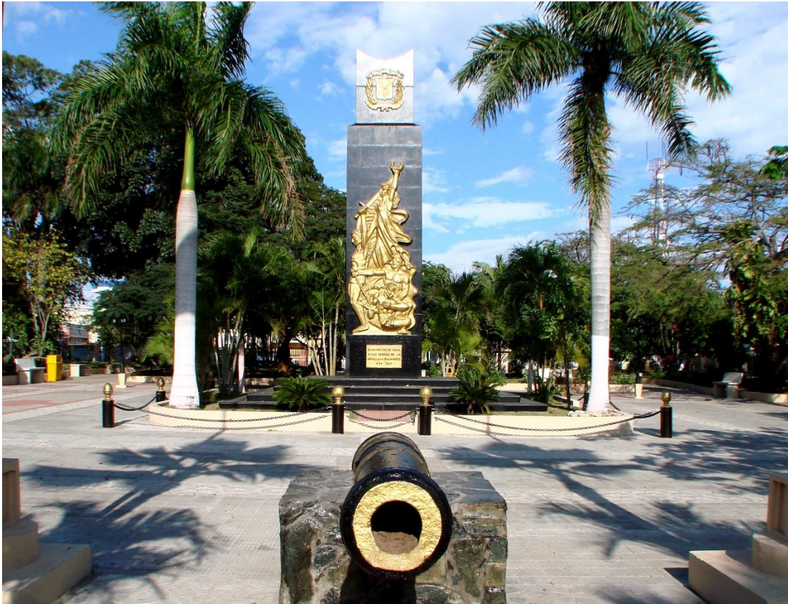
Monumento a los Héroes de la Batalla 19 de marzo de 1844-AZUA.