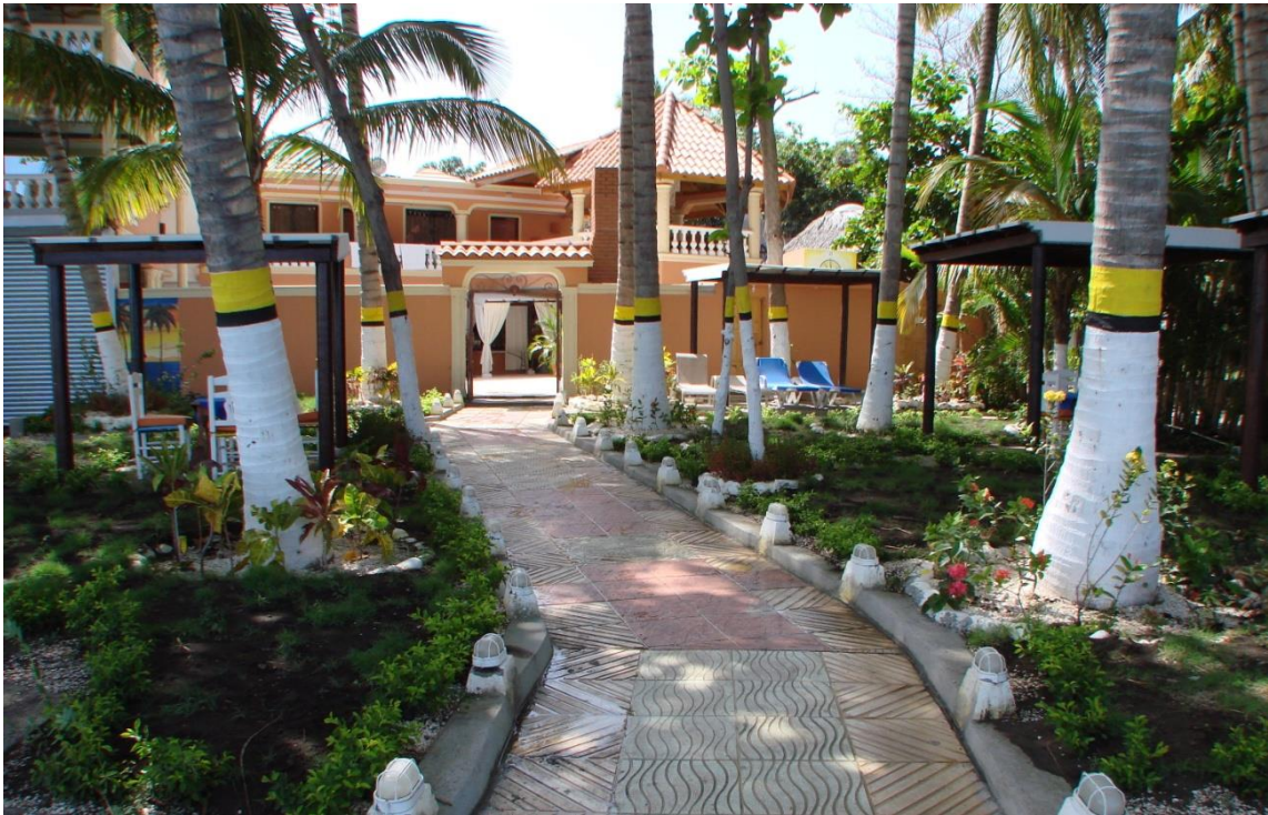
Residencia ubicada en la Playa de Palmar de Ocoa-Azua.