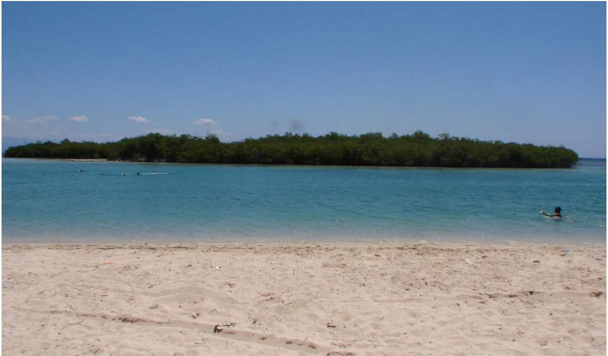
Imponente islote en la playa Caobita de Barrera-Azua.