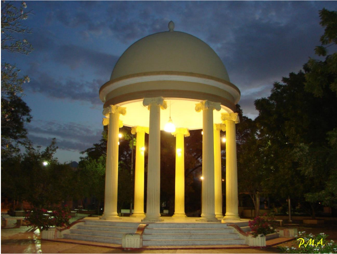
Glorieta del Parque Duarte de Azua.