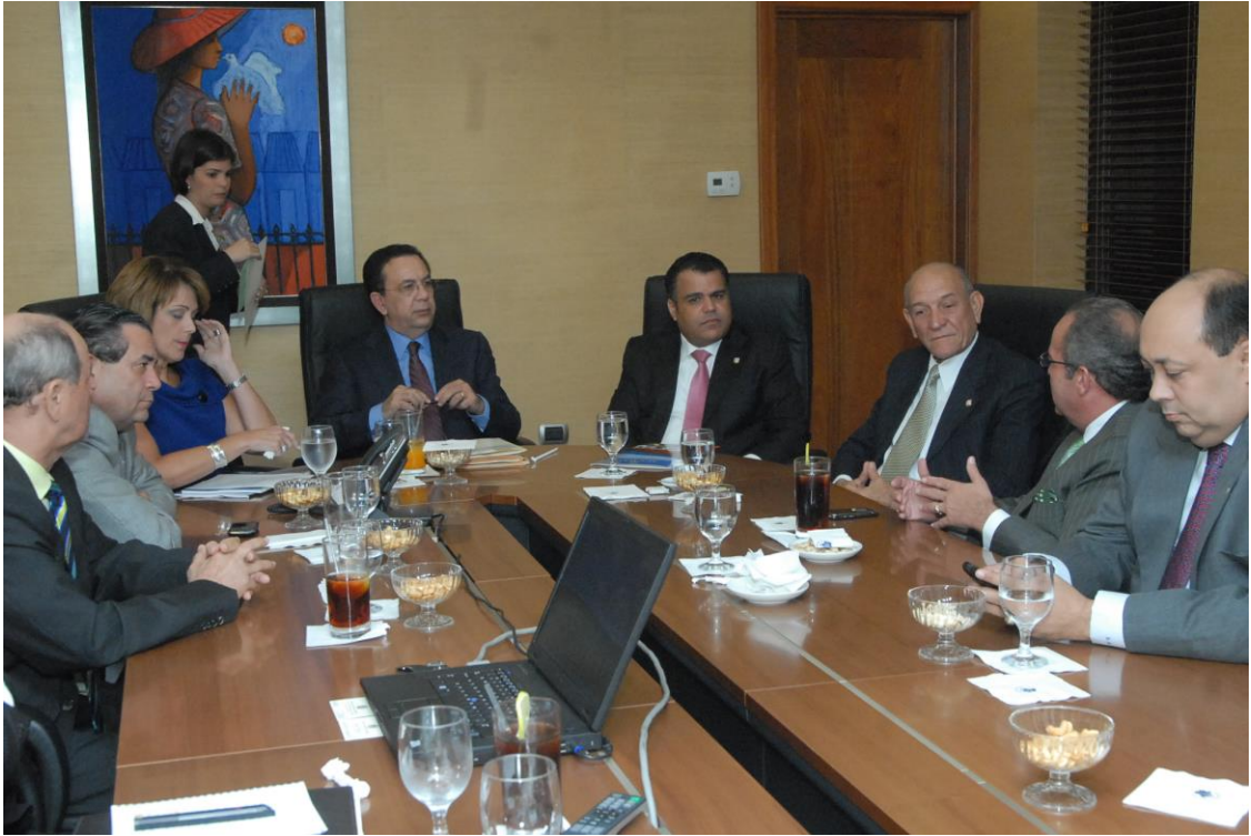
Reunión Comisión Permanente de Hacienda.