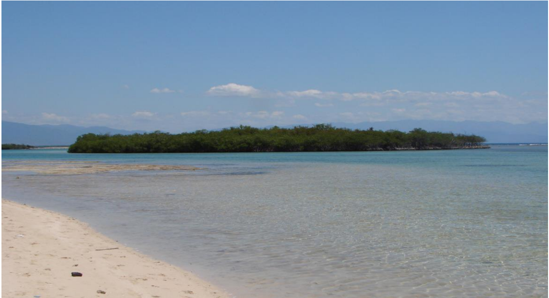
Imponente y hermosa playa de Caobita, Barrera, Azua.