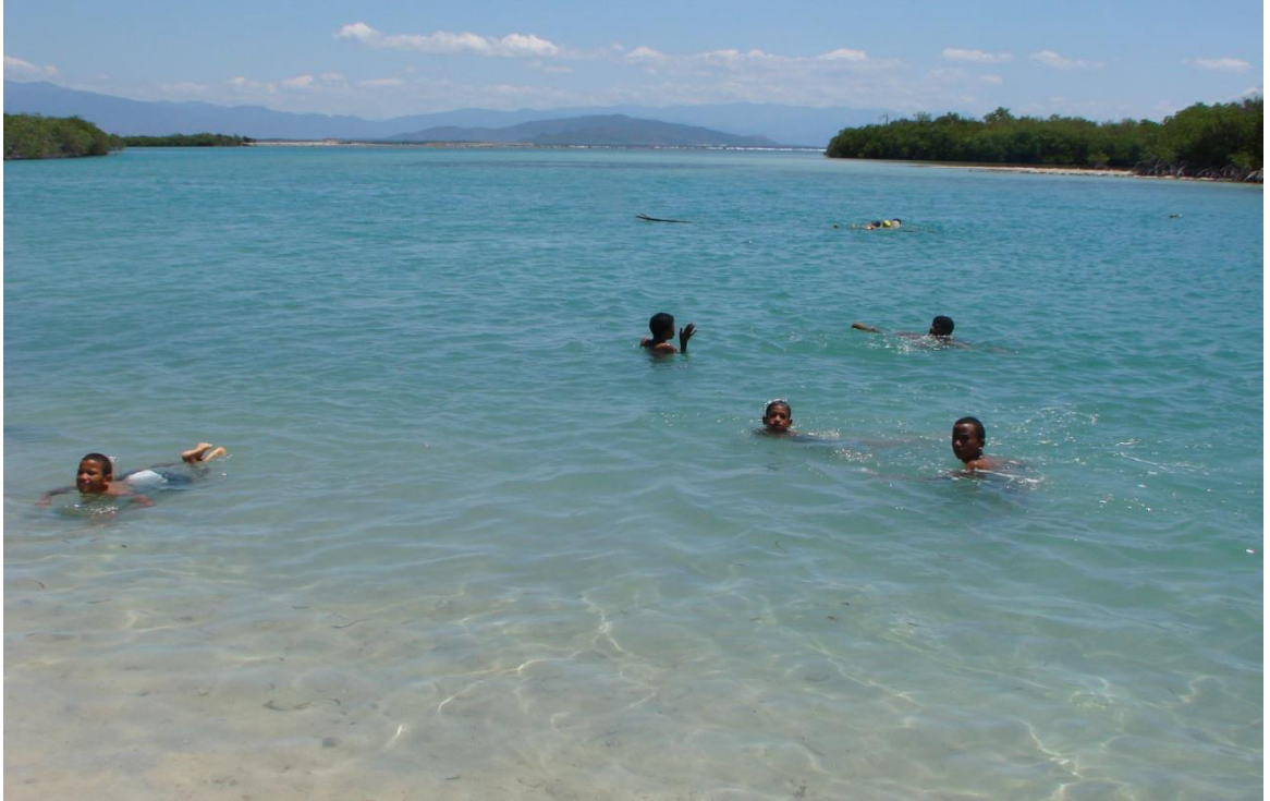
Playa Caobita en los Distritos Municipales de Barrera y Los Negros