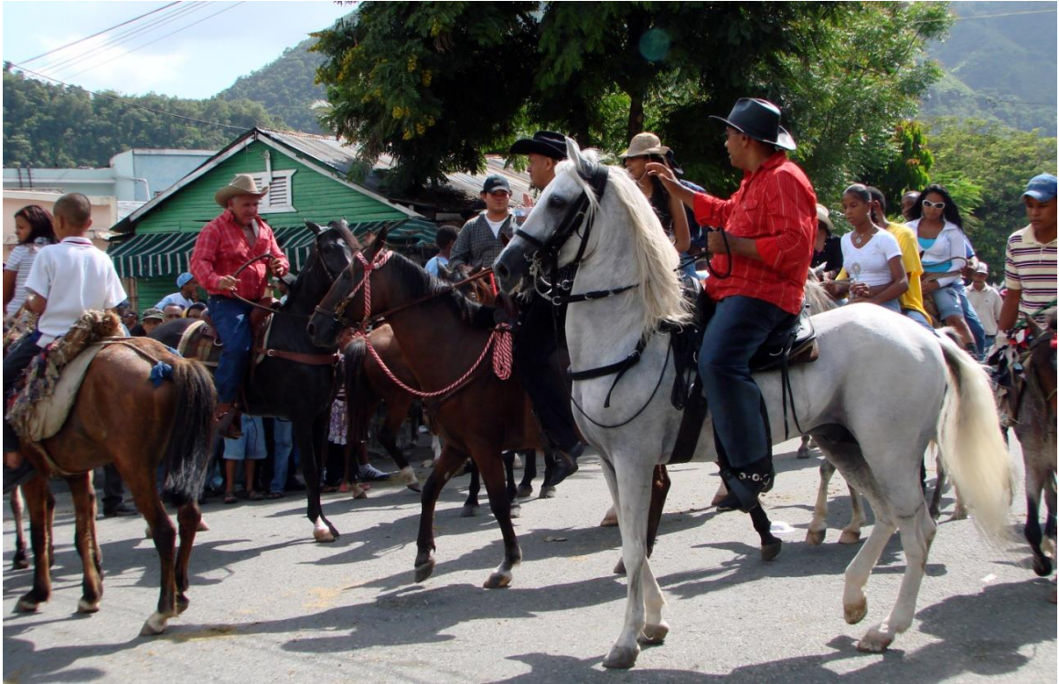
Celebración fiestas patronales en Peralta, Azua.