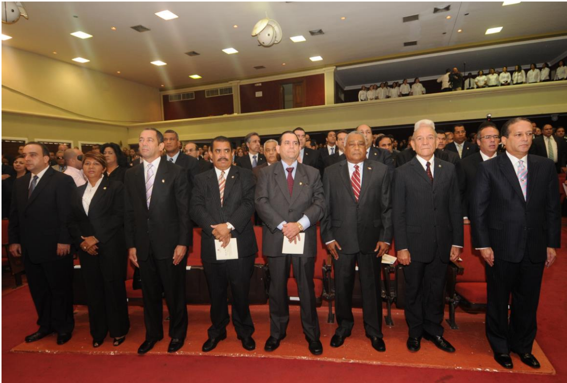
Acto de organizado por la Junta Central Electoral para la entrega de certificados de elección a los legisladores electos en las elecciones generales del año 2010.