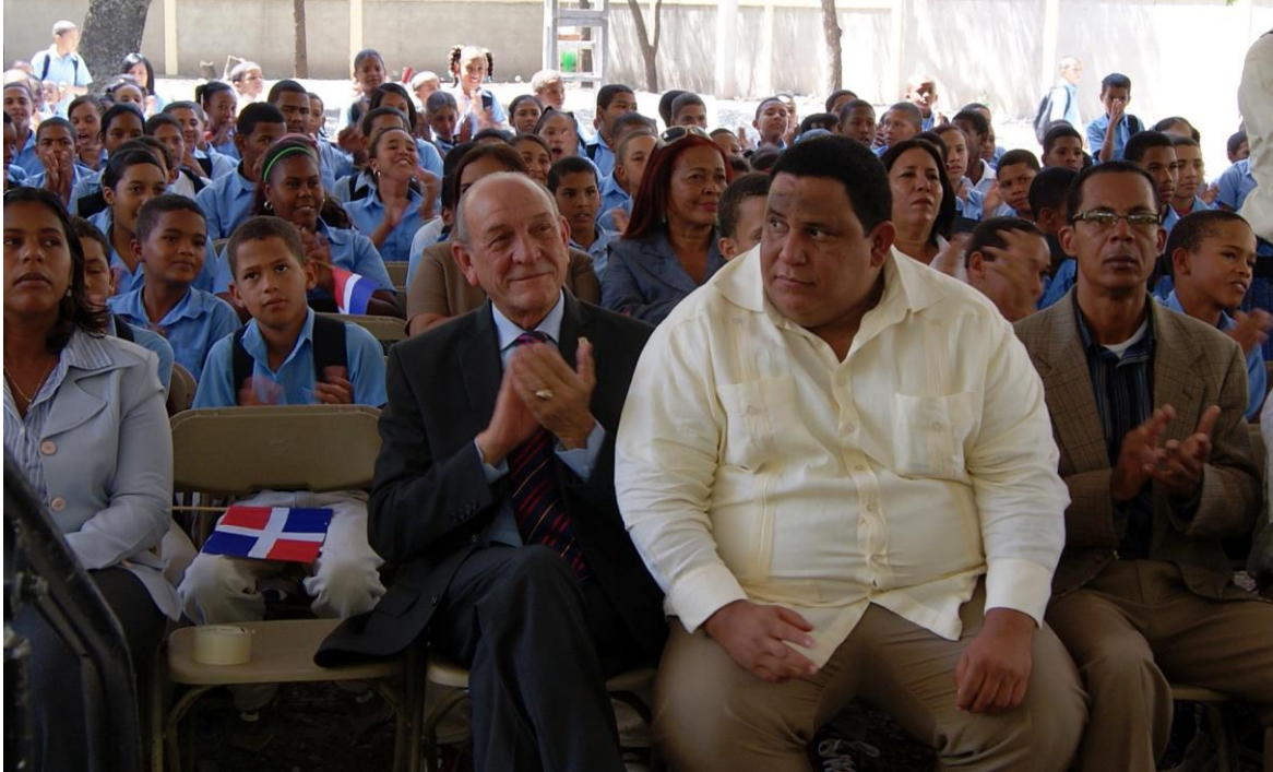
Acto en el Palacio Municipal de Azua con estudiantes de la escuela primaria.