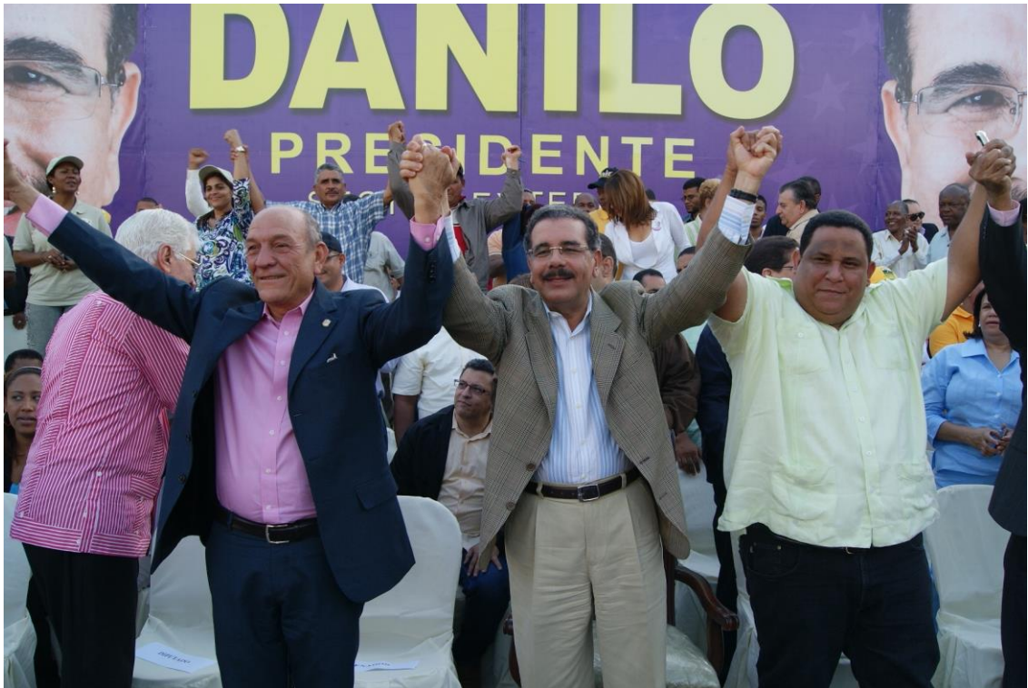
Acto político en Azua con la participación del candidato presidencial del PLD.