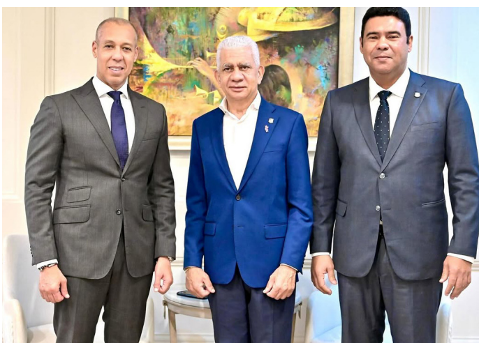
Visitas de cortesía diplomáticas al embajador dominicano en Guyana.