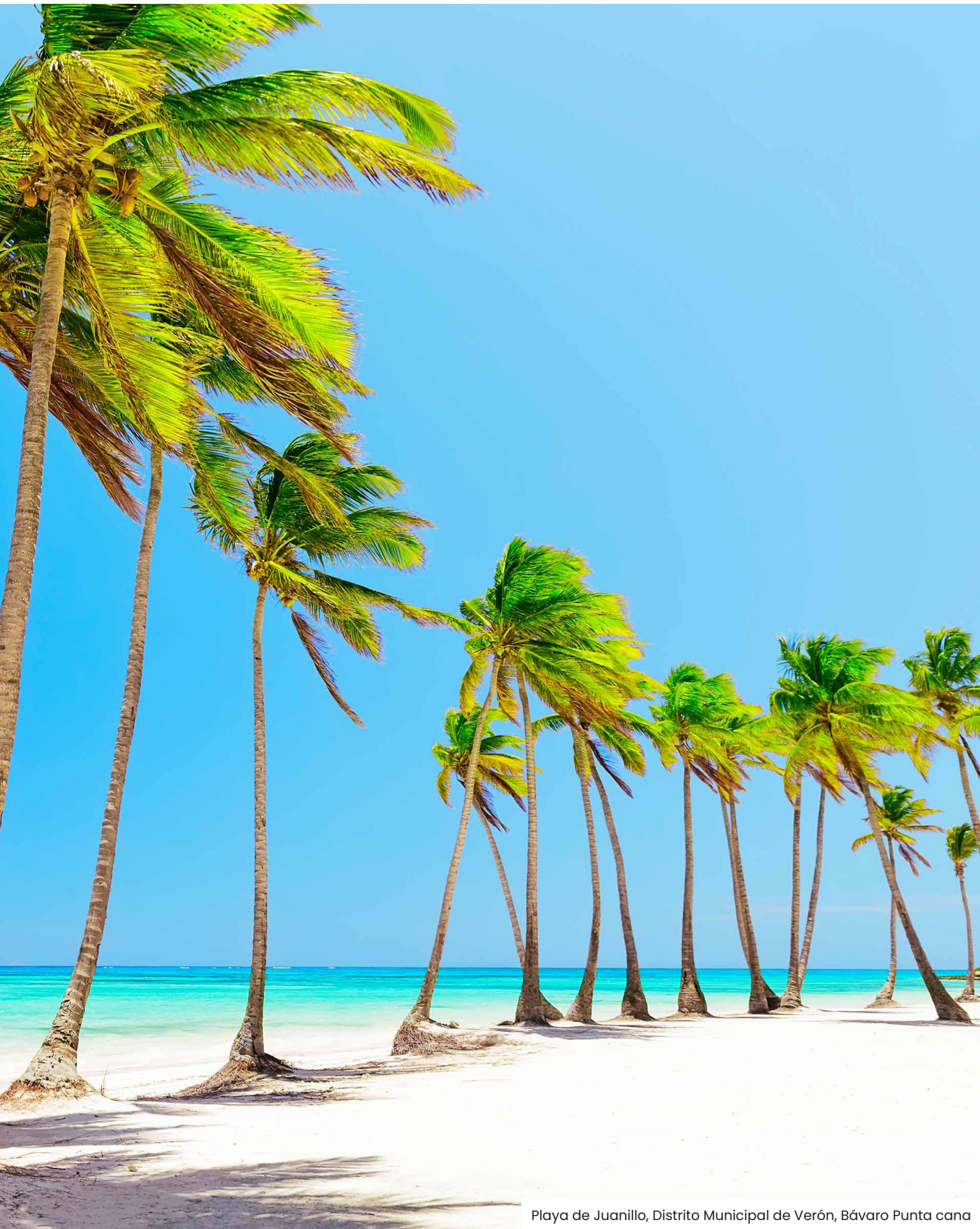
Playa de Juanillo, Distrito Municipal de Verón, Bávaro Punta cana