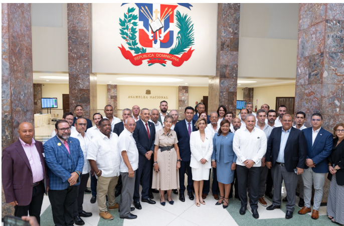
Encuentro con la Alianza Empresarial de Desarrolladores y Constructores de la Zona Este, sobre la reforma fiscal.