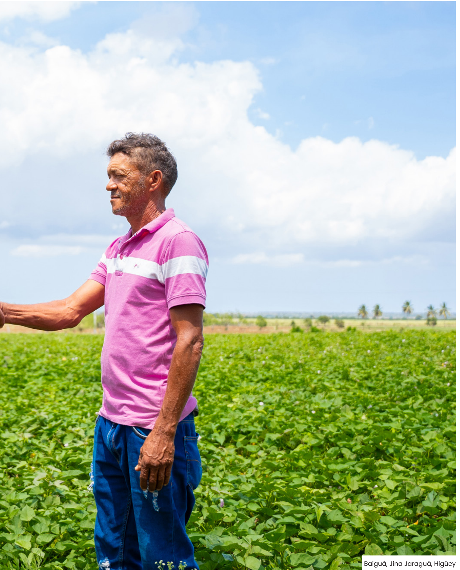
Baiguá, Jina Jaraguá, Higüey