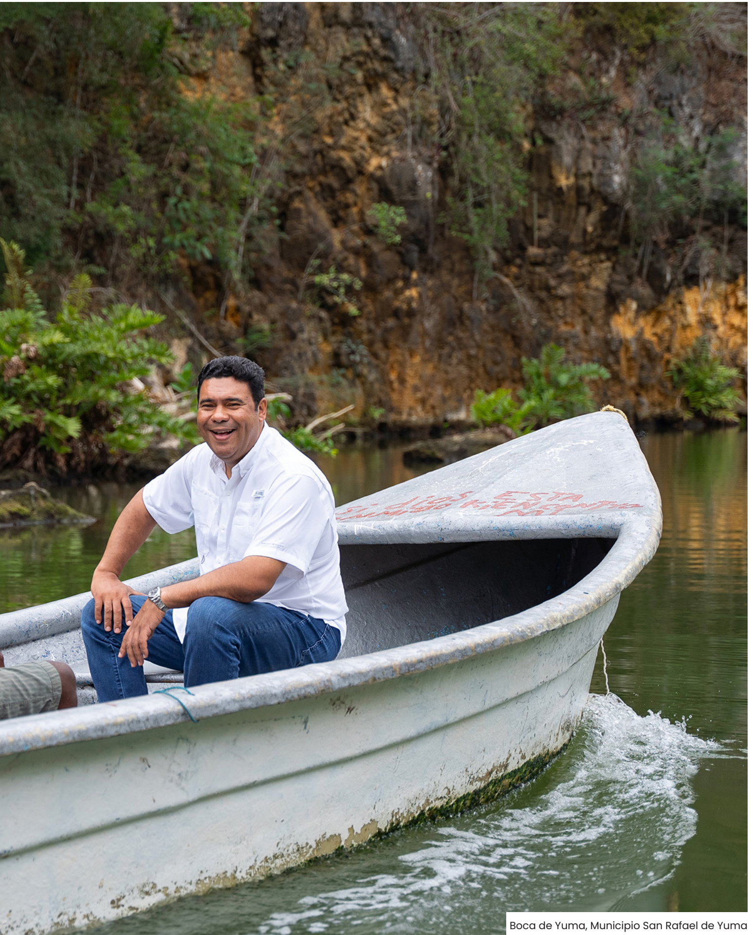
Boca de Yuma, Municipio San Rafael de Yuma