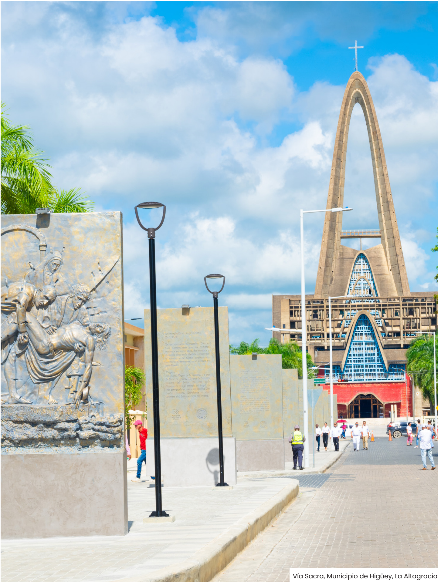
Vía Sacra, Municipio de Higüey, La Altagracia