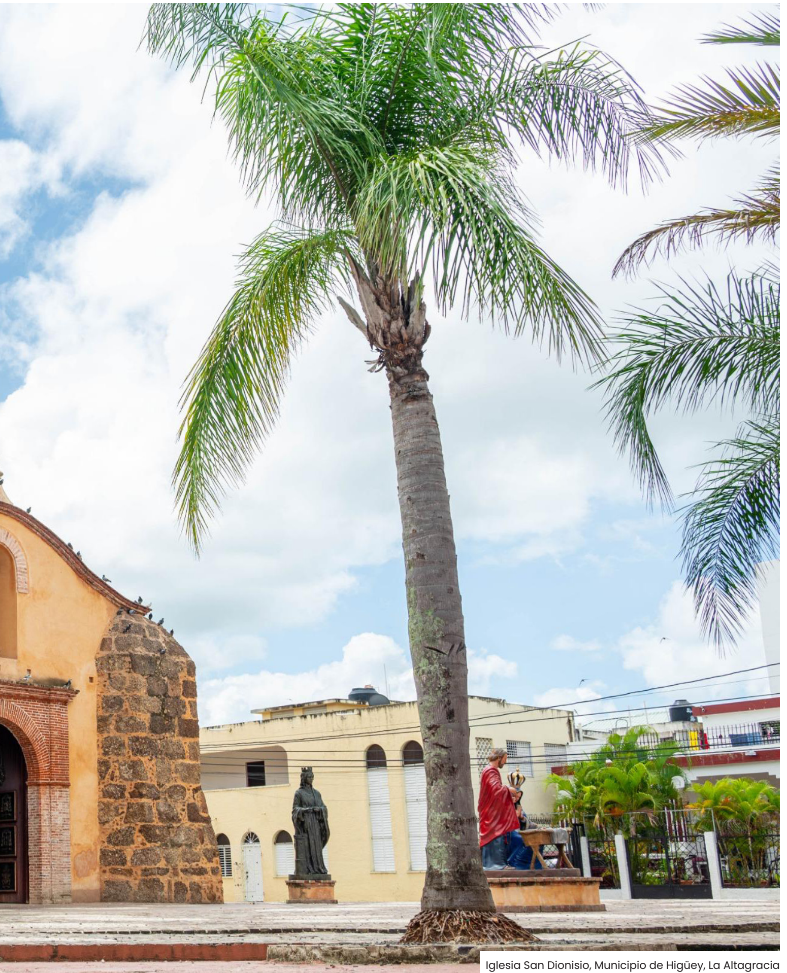
Iglesia San Dionisio, Municipio de Higüey, La Altagracia