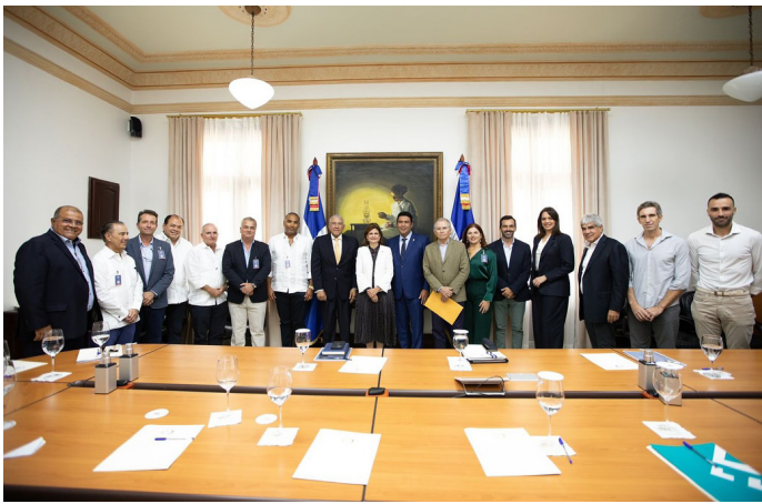
Reunión con la Vicepresidenta Raquel Peña y empresarios turísticos para impulsar el desarrollo de la provincia.