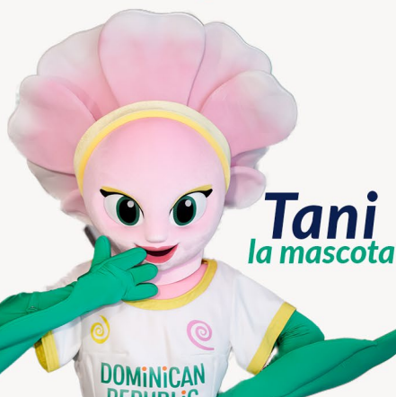
Tani la mascota

Esta actividad esta diseñada para los hijos de nuestros colaboradores entre 5 a 15 años de edad. Lobby bicameral, Congreso Nacional.