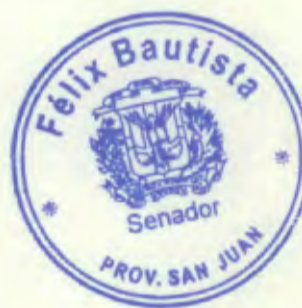
Félix Bautista Senador Provincia San Juan

Agradeciendo su especial colaboración, les saludo con sentimientos de la más alta consideración.