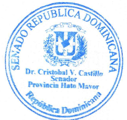
Dr. Cristóbal V. Castillo L. Senador de la República Dominicana. Provincia Hato Mayor