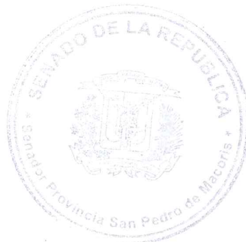
Dr. Franklin Peña V. Senador por la Provincia San Pedro de Macorís.