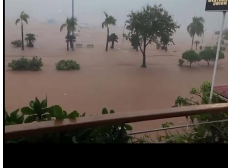
Vista de archivo de las inundaciones ocurridas en la provincia Samaná

Acta núm. 0051, del martes 03 de junio de 2025, pág. núm. 45 de 93