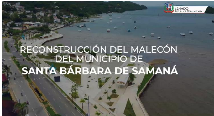
Vista aérea del malecón en la provincia Samaná

Acta núm. 0051, del martes 03 de junio de 2025, pág. núm. 46 de 93