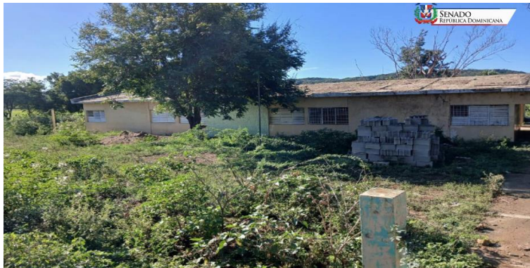
Vista de un plantel escolar en construcción

Ahí están las escuelas, totalmente paradas, luce ser que es por falta de mano de obra, Como vemos: escuelas importantes, escuelas grandes, escuelas pequeñas, escuelas en campos, que los niños no pueden trasladarse a otras escuelas; le pedimos al presidente de la República que, por favor, nos ayude a terminar todos estos planteles escolares, que muchos de ellos hay que demolerlos totalmente.