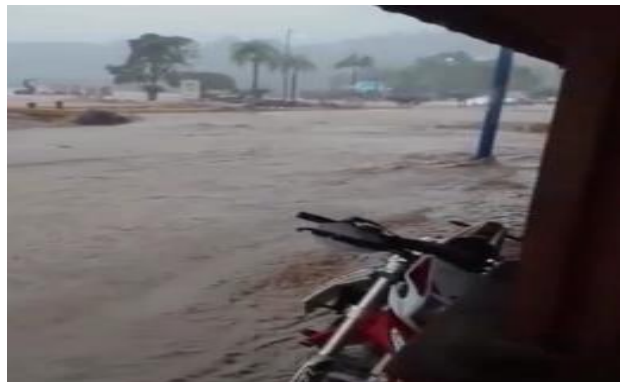
Vista de archivo de las inundaciones ocurridas en el malecón de Samaná