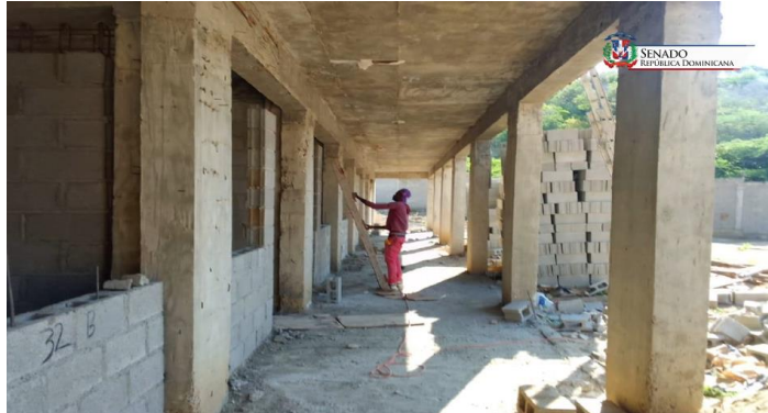
Vista interior de un plantel escolar en construcción

Acta núm. 0051, del martes 03 de junio de 2025, pág. núm. 41 de 93