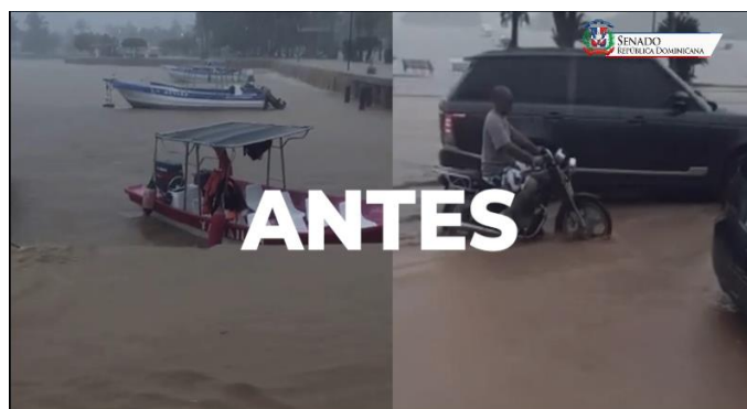
Vista de archivo de las inundaciones ocurridas en la provincia Samaná

Voz en off de un ciudadano: El malecón de Samaná parece el Bajo Yuna ahora mismo.