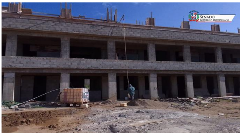
Vista frontal de un plantel escolar en construcción