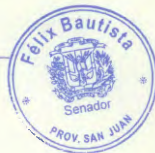
Félix Bautista Senador Provincia San Juan

Agradeciendo su especial colaboración, les saludo con sentimientos de la más alta consideración.