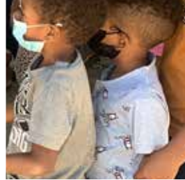
SENADOR DONA MILES DE JUGUETES A NIÑOS DE LA PROVINCIA