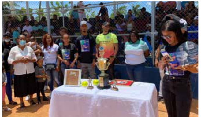
SENADOR APTROCINA TRONEO SOFBALL HOMENAJE AL CHAMO