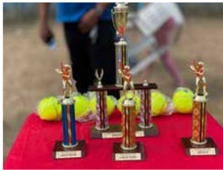
SENADOR PATROCINA TRIANGULAR SOFBALL PLEZ JAMATE KM5