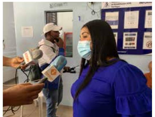
SENADOR DONA SUELDO COMPLETO DE UN MESA ADR NAGUA