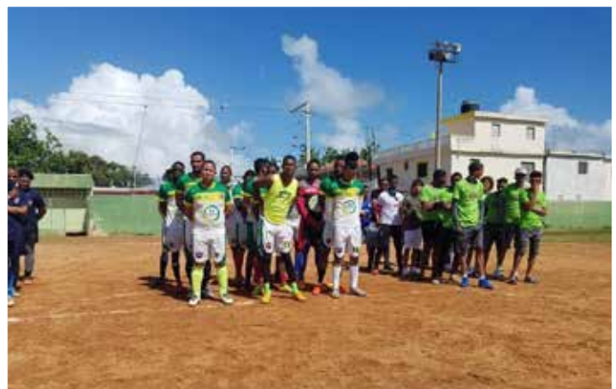
PATROCINIO TORNEOS DE FUTBOL MTS