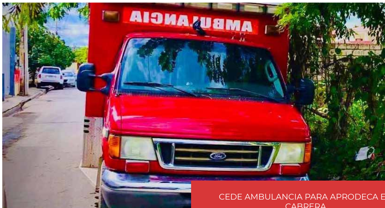
CEDE AMBULANCIA PARA APRODECA EN CABRERA