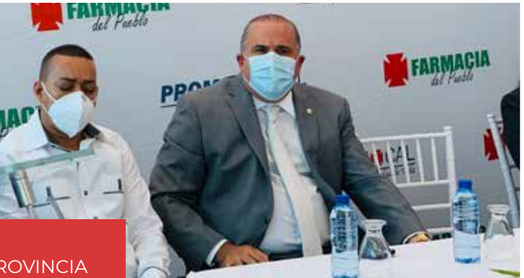
SENADOR PIDE MEDICAMENTOS PARA PROVINCIA