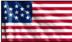
Estados Unidos (Miembro)