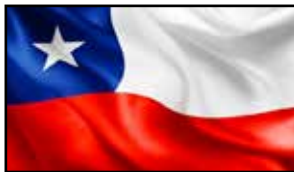
República de Chile (Presidente)