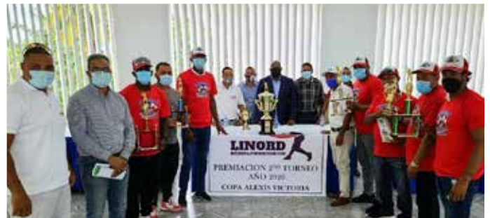
SENADOR RECIBE EQUIPO CAMPEON TONEO BEISBOL LINOR QUE PATROCINO LA OFICNA SENATORIA