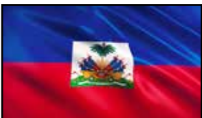
República de Haití (Miembro)